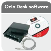
Ocio Desk software