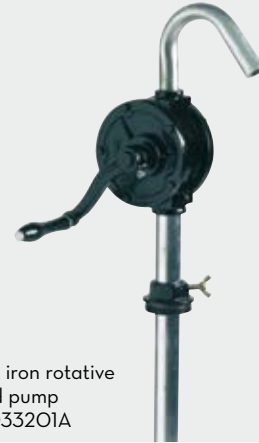
Cast iron rotative hand pump FOO33201A