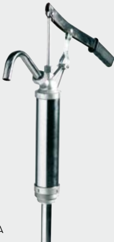
Piston hand pump 25 l/m' FOO34900A