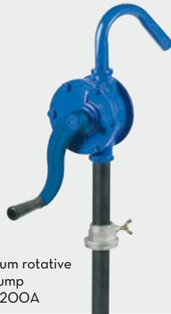
Aluminium rotative hand pump FOO33200A