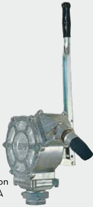
PM GPI Piston FOO31600A