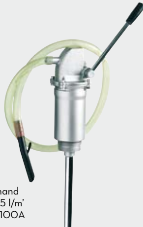
Piston hand pump 35 l/m' FOO35100A